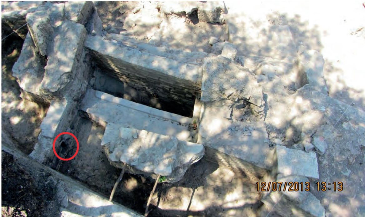
Res. 1: Altın sikkelerin bulunduğu açmanın görünümü.