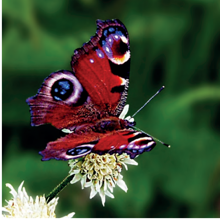
Res. 5: Tavus Kelebeđi ( Inachis io )