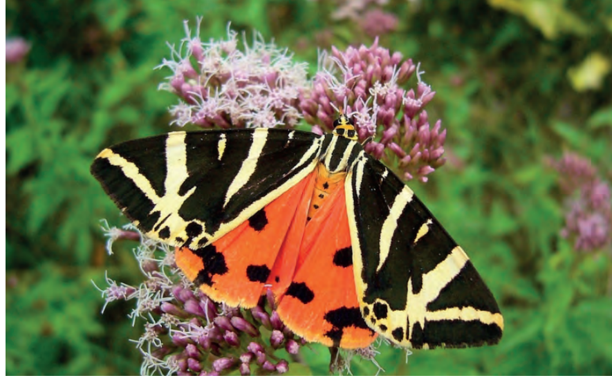
Res. 2: Kaplan Kelebeđi ( Euplagia Quadripunctaria )