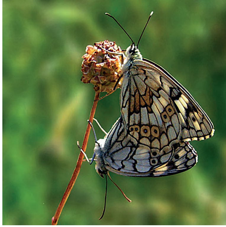
Res. 1: Anadolu Melikesi ( Melanargia Larissa )