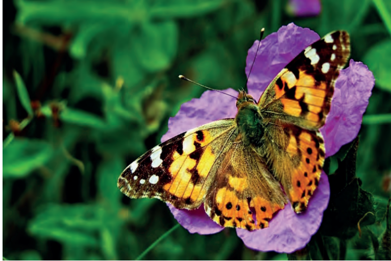
Res. 4: Diken Kelebeği (Vanessa Cardui)