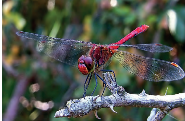
Res. 6: Yusufcuk ( Ainosptera )