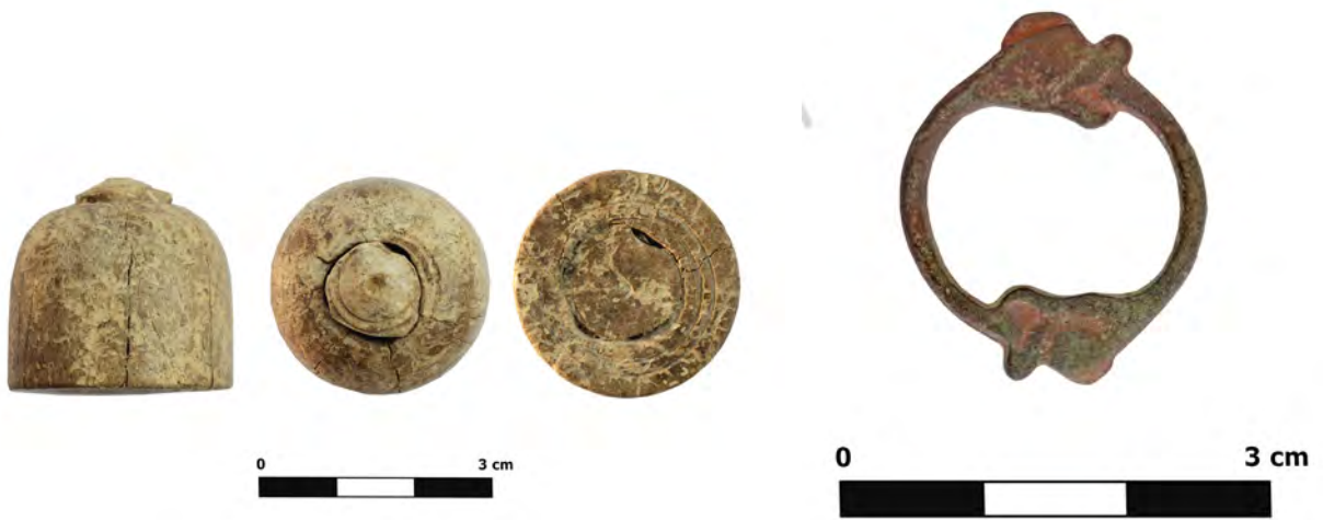
Res. / Fig. 6: