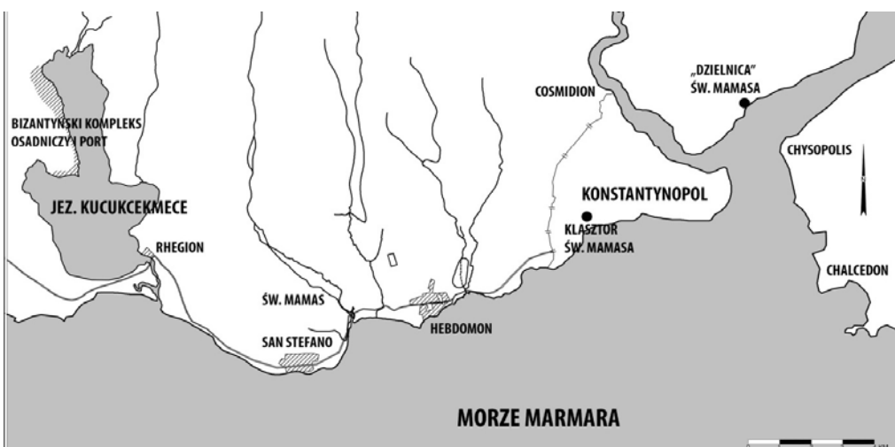
Res. / Fig. 4 The localization of the settlement complex situated at the western coast of the Küçükçekmece lake and St. Mamas river.