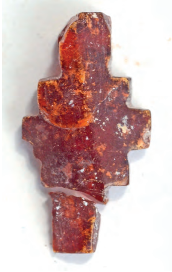
Res. / Fig. 5: The amber cross founded on the settlement complex located at the western coast of the Küçükçekmece lake..