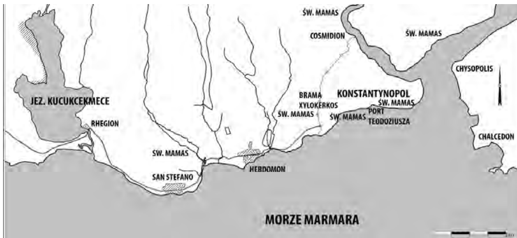
Res. / Fig. 3. The hypothetical localizations of St. Mamas objects in Constantinople.