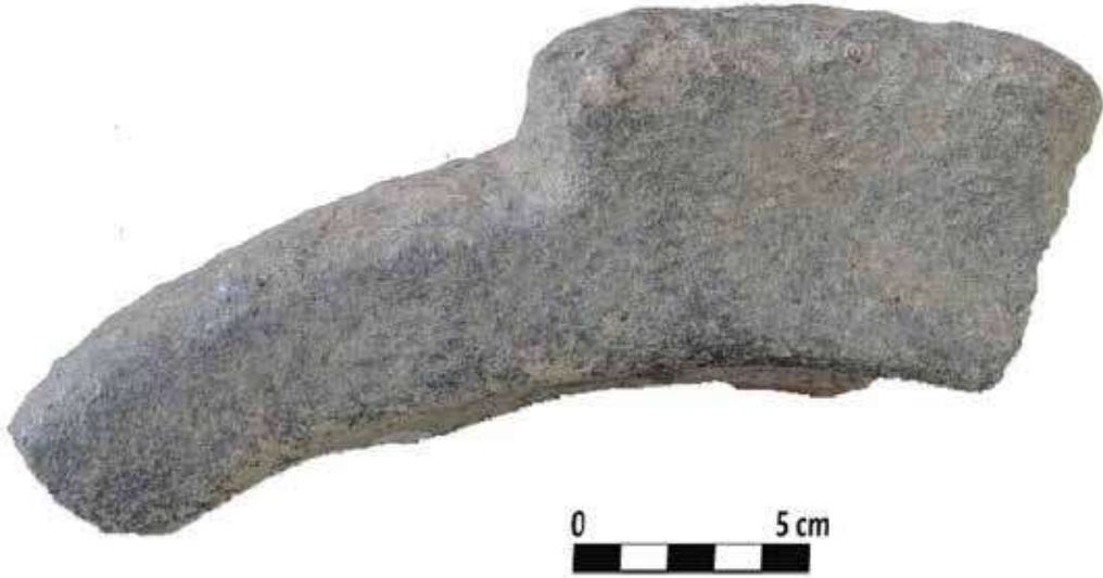
Şek. 14: Taş, tutamaklı mortarium parçası Fig. 14: Stone, fragment of mortarium with handle