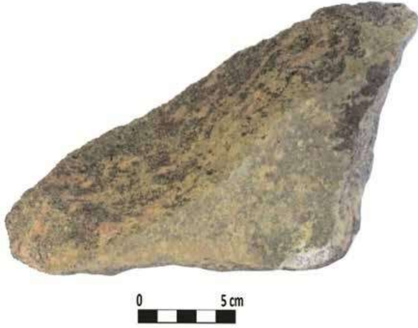
Şek. 21: Taş, mortarium gövde parçası Fig. 21: Stone, fragment of mortarium