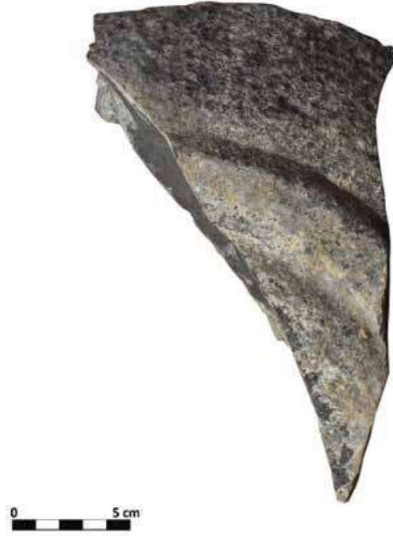
Şek. 23: Taş, mortarium dip parçası Fig. 23: Stone, mortarium fragment of the base