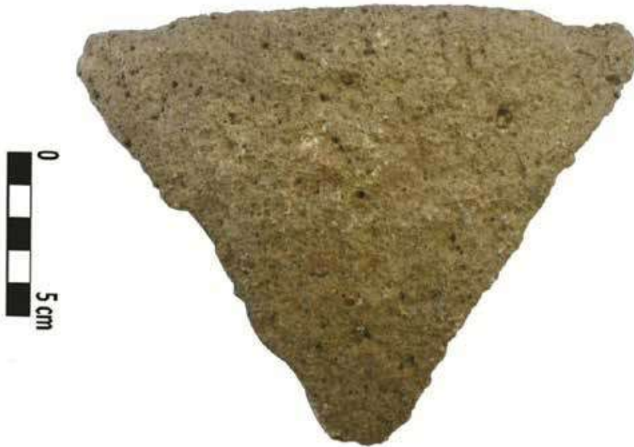
Şek. 20: Taş, mortarium parçası Fig. 20: Stone, fragment of mortarium