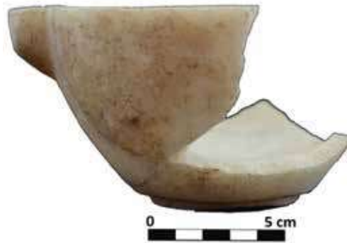
Şek. 12a-12b: Mermer, tutamaklı sığ mortarium parçası Fig. 12a-12b: Marble, fragment of shallow mortarium with handles