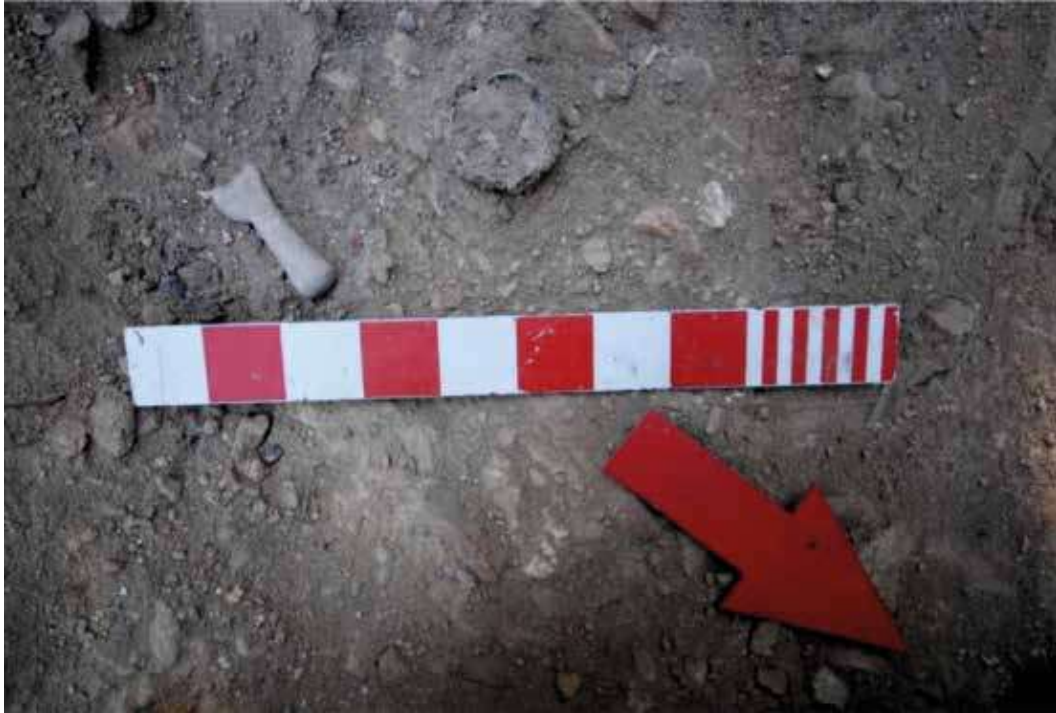
Şek. 28: Mortarium Pilium bulunma anı (Fotoğraf: Bathonea Kazı Arşivi, 2013) Fig. 28: In situ of Mortarium Pilium (Photograph: Bathonea Excavation Archive, 2013)