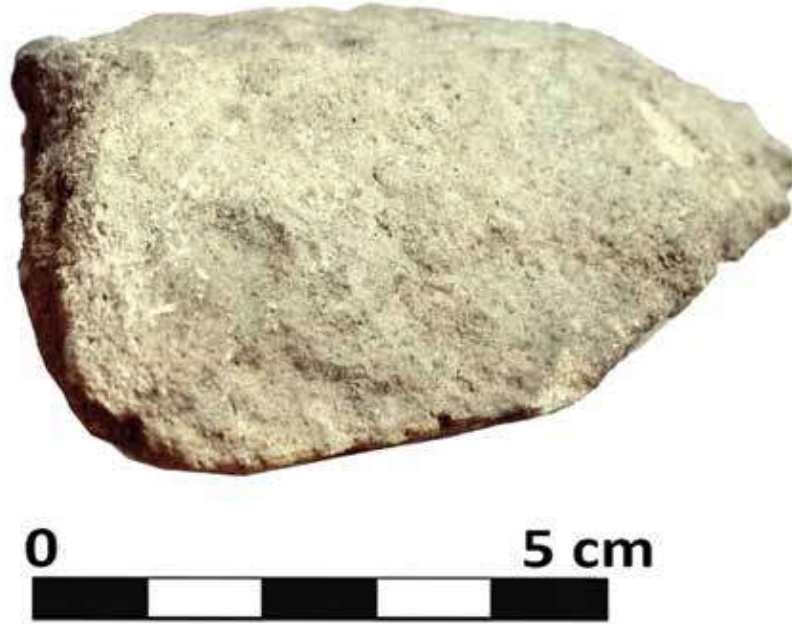
Şek. 27: Taş, mortarium ağız parçası Fig. 27: Stone, rim fragment of the mortarium