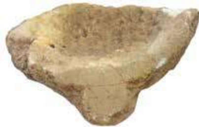
Şek: 6a-6b: Mermer, yapımı tamamlanmamış tutamaklı sığ mortarium parçası Fig: 6a-6b: Marble, fragment of shallow mortarium with handles