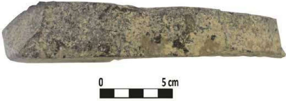
Şek. 25: Taş, mortarium dip parçası Fig. 25: Stone, mortarium fragment of the base