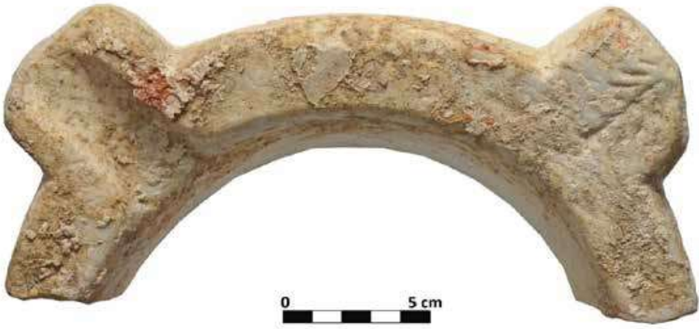
Şek. 26: Mermer, akıtaçlı mortarium ağız parçası Fig. 26: Marble, lip mortarium base