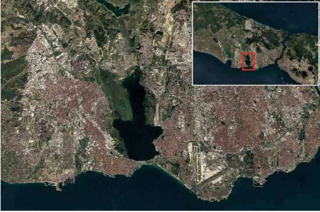
Şek. 1: Küçükçekmece Göl Havzası (Google Earth) Fig. 1: Küçükçekmece Lake Basin (Google Earth)