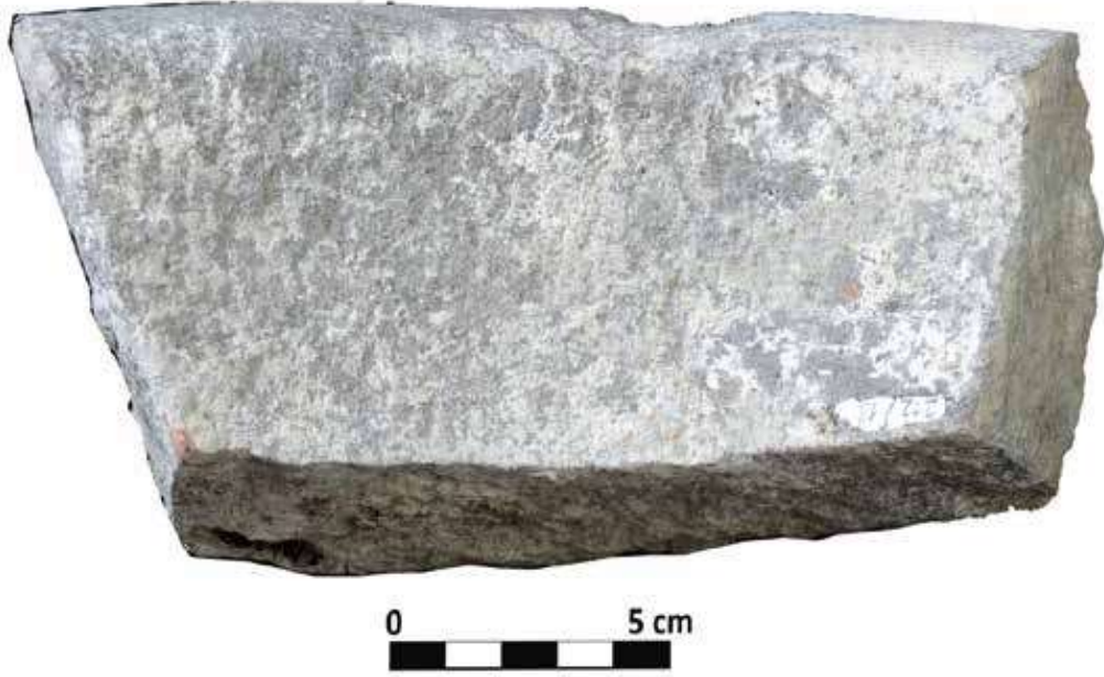
Şek. 19: Taş, mortarium gövde parçası Fig. 19: Stone, fragment of mortarium