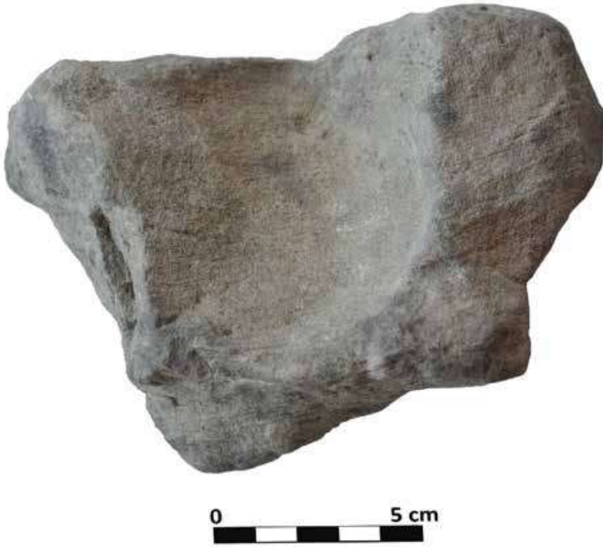
Şek. 18: Taş, mortarium gövde parçası Fig. 18: Stone, fragment of mortarium