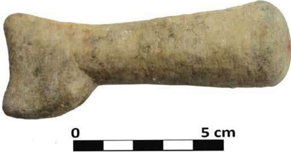
Şek. 29: Mermer, sap kısmı bükülmüş parmak formu ya da dirsek şeklinde Mortarium Pilium Fig. 29: Marble, curved finger-shaped or elbow-shaped handle of Mortarium Pilium