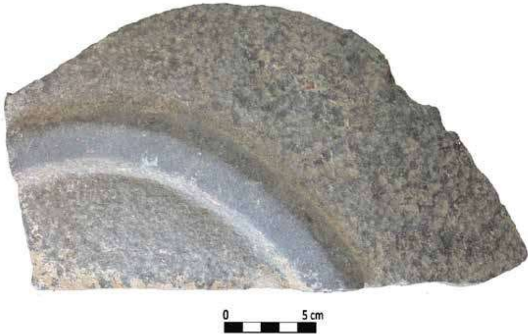
Şek. 22: Taş, mortarium dip parçası Fig. 22: Stone, mortarium fragment of the base