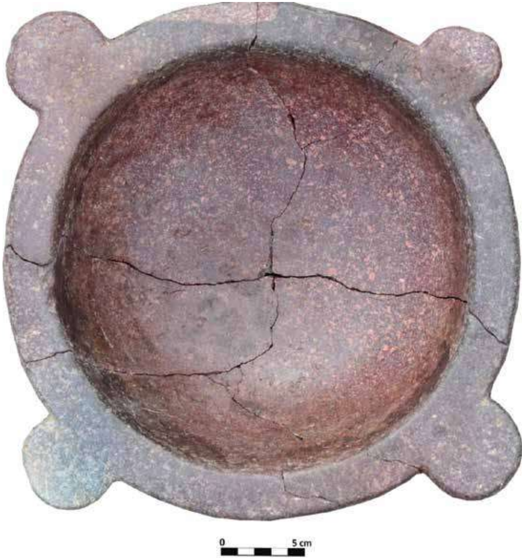
Şek: 5: Porfir, tutamaklı derin mortarium Fig: 5: Porphyry, deep mortarium with handles