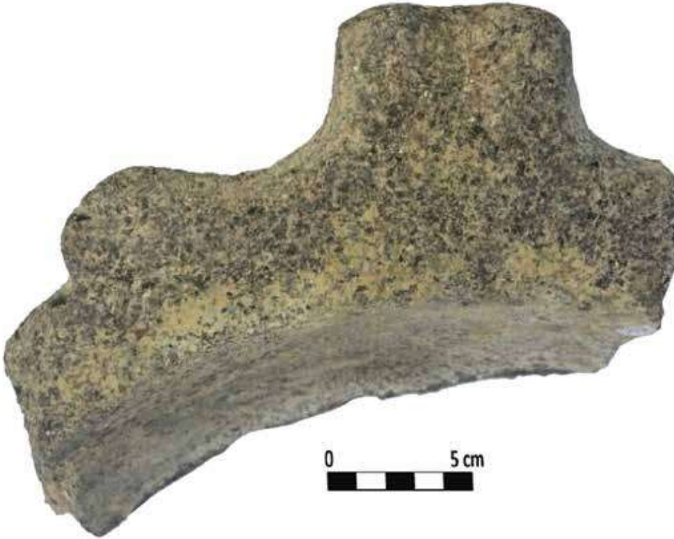
Şek. 10: Taş, akıtıçlı mortarium parçası Fig. 10: Stone, fragment of a corrugated tube mortarium