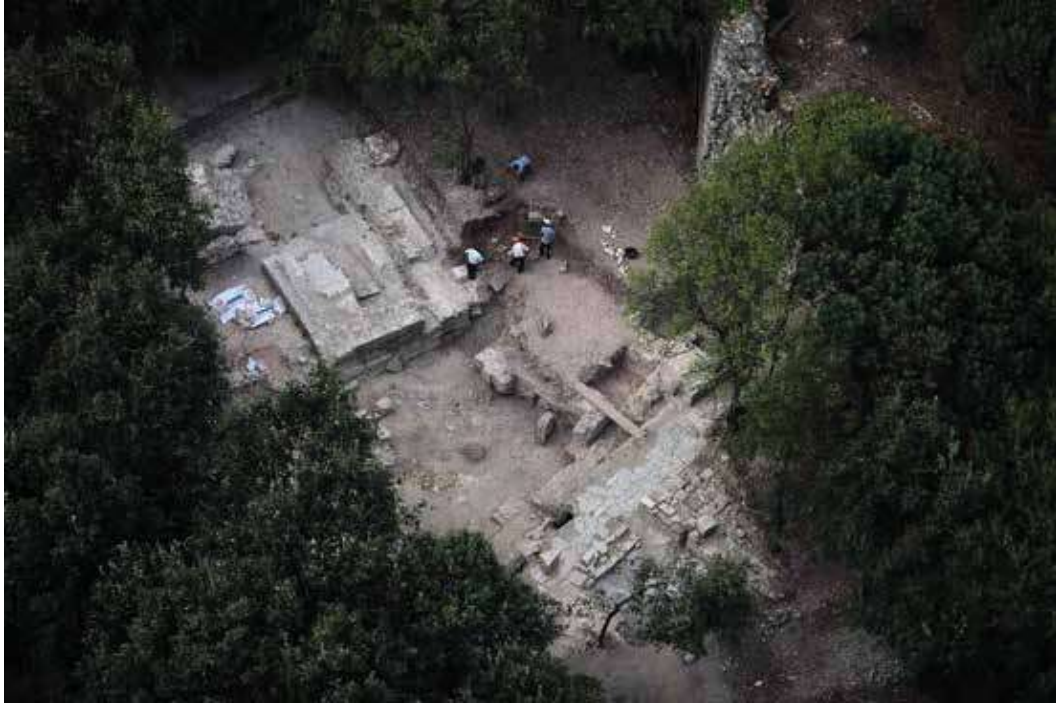
Şek. 4: Bazilikal Planlı Yapının kazılarına başlarken