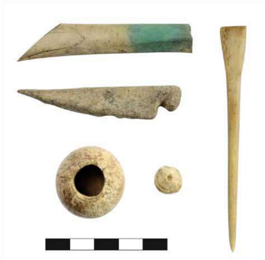
Şek. 34: Kemikten ilaç karıştırıcıları ve merhem kutusu Fig. 34: Bone medicine mixers and ointment box