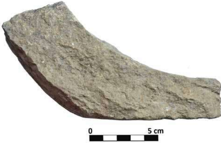
Şek. 17: Taş, mortarium gövde parçası Fig. 17: Stone, fragment of mortarium