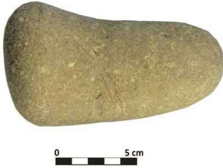
Şek. 33: Taş, Mortarium Pilium (Fotoğraf: A. Enez, 2019) Fig. 33: Stone, Mortarium Pilium (Photograph: A. Enez, 2019)