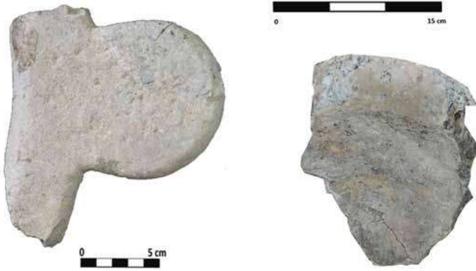
Şek: 7a-7b: Taş, tutamaklı derin mortarium parçası Fig. 7a-7b: Stone, fragments of a deep mortarium with handles