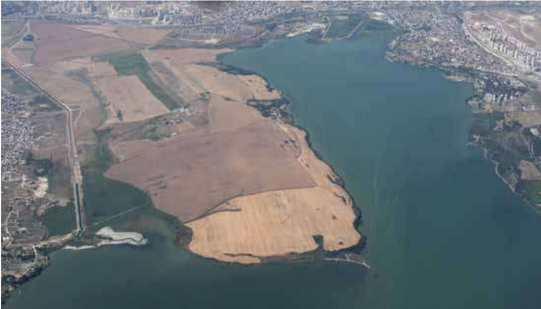
Şek. 2: Avcılar Firuzköy Yarımadası Fig. 2: Avcılar, Firuzköy Peninsula