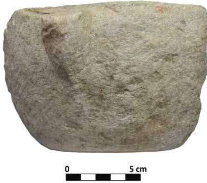
Şek. 9: Mermer, tutamaklı sığ mortarium parçası Fig. 9: Marble, fragment of shallow mortarium with handles