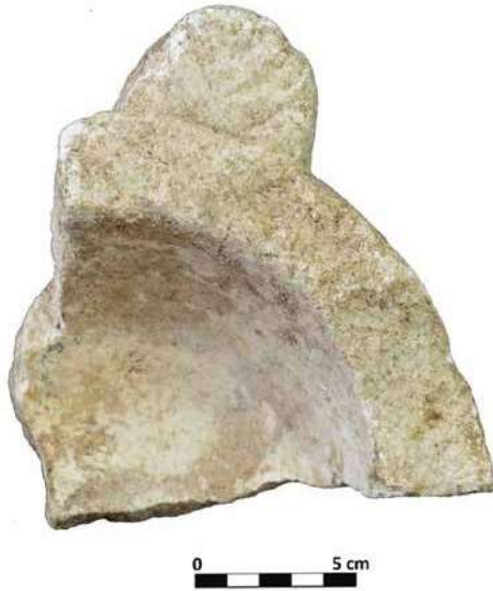
Şek. 8: Mermer, tutamaklı sığ mortarium parçası Fig. 8: Marble, fragment of shallow mortarium with handles