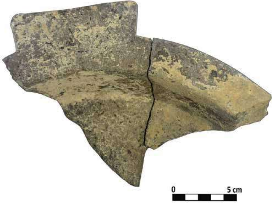
Şek. 13: Taş, tutamaklı sığ mortarium parçası Fig. 13: Stone, fragment of shallow mortarium with handles