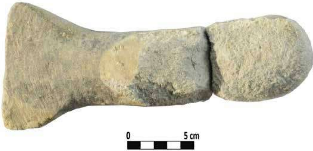
Şek. 30: Mermer, sap kısmı bükülmüş parmak formu ya da dirsek şeklinde Mortarium Pilium Fig. 30: Marble, curved finger-shaped or elbow-shaped handle of Mortarium Pilium