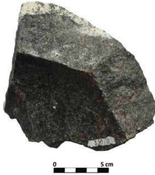
Şek. 24: Taş, mortarium dip parçası Fig. 24: Stone, mortarium fragment of the base