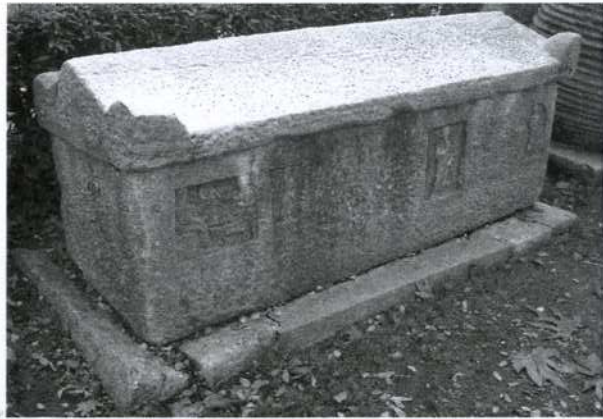
Res. 1: Bathonealı Rufus oğlu Damas'ın lahdi, İstanbul Arkeoloji Müzeleri bahçesi (O. Tekin).

orada polis statüsünde ayrı bir kent bulunması söz konusu değildi. Zira, Küçükçekmece'nin kendisi dahi, Antik Çağ'da Rhegion 3 adıyla bilinen bir köydü ve Byzantion'a bağlıydı. Bu nedenle, Rhegion ve civarı gerçekte Byzantion'un “kendisidir”; siyasal ve toplumsal yapı itibarıyla bağımsız veya münferit bir oluşum olarak